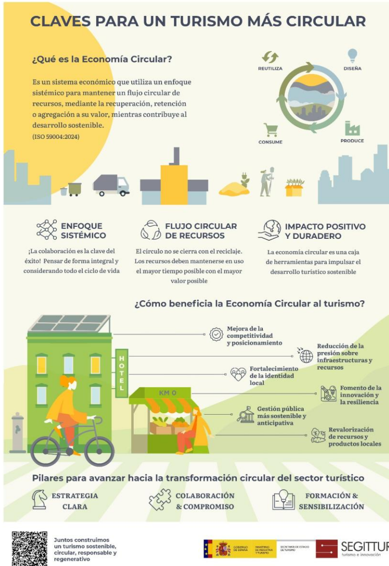
Ilustración 1. Infografía "Turismo y Economía Circular" de SEGITTUR.

impacto ambiental y progreso económico, y simultáneamente debiendo velar por integrar también el impacto social positivo en su desarrollo.