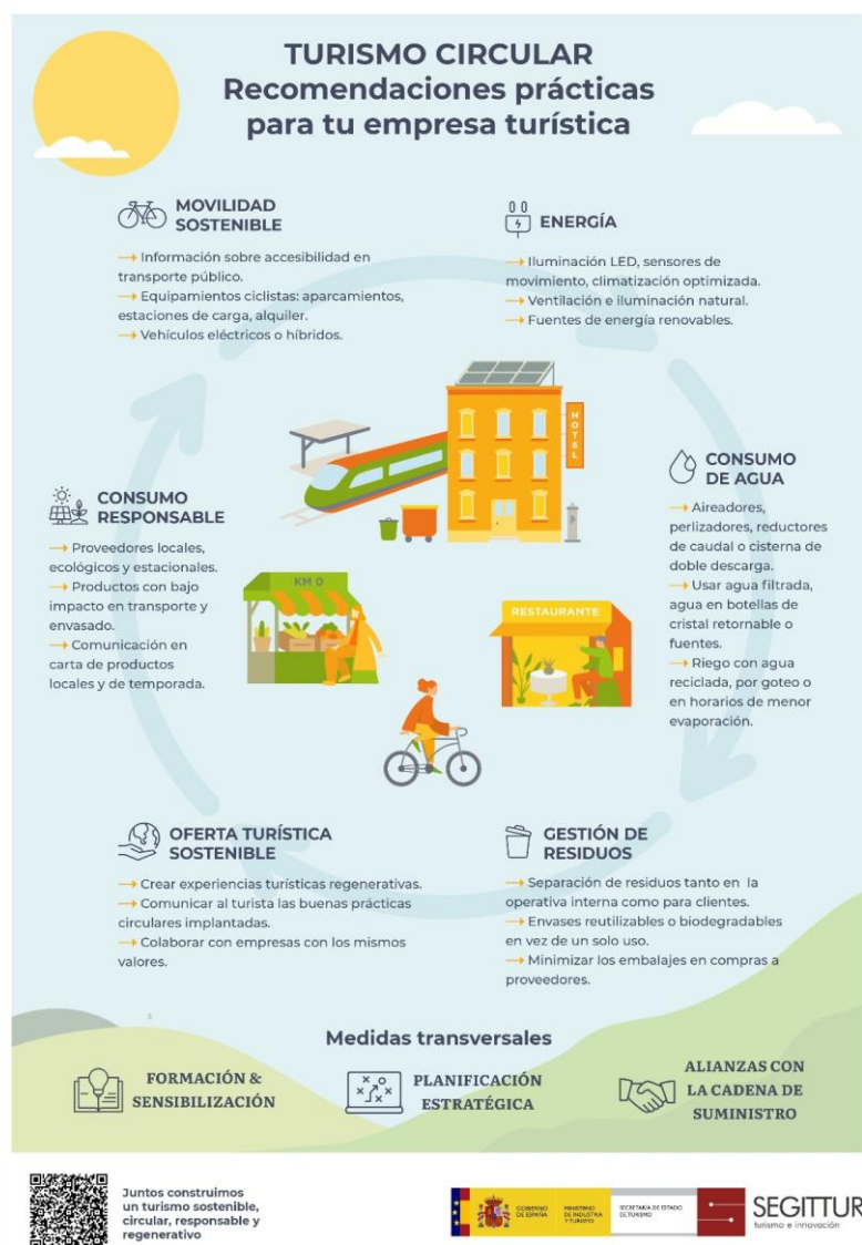
Ilustración 2. Infografía "Turismo Circular aplicado a empresas" de SEGITTUR.