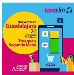
Imagen 3. Feria de Economía Circular.

Otra iniciativa significativa es la Feria de Economía Circular que, de momento, solo ha cumplido con dos ediciones. La feria busca sensibilizar sobre la reutilización y la producción sostenible a través de stands de productos reciclados y ecológicos, talleres de reciclaje y reparación, charlas, y mercadillos de trueque y segunda mano. Este evento representa un esfuerzo clave para fomentar la sostenibilidad en la ciudad. Aunque su continuidad se vio afectada por la renuncia del adjudicatario