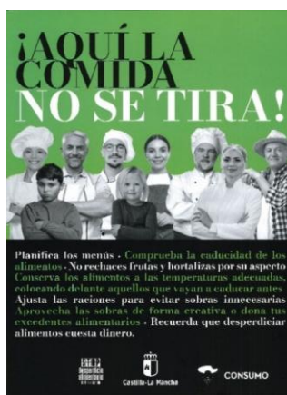
Imagen 2. Campaña "Aquí la comida no se tira".

El desperdicio alimentario es otro reto importante para tener en cuenta. Según las estimaciones de la " Guía metodológica para la implantación de la recogida selectiva de la materia orgánica de Castilla-La Mancha ", Guadalajara es la segunda capital de provincia con mayor desperdicio alimentario en la región, solo por detrás de Albacete. Para abordar los retos asociados al desperdicio alimentario se han implantado distintas iniciativas públicas y privadas en la ciudad. Entre ellas se encuentra la App " Too Good to Go " que llegó a la ciudad en 2021, con 30 establecimientos adheridos, aunque se desconocen su impacto y aceptación general.